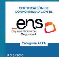
ENS Categoría ALTA